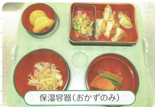
保温容器(おかずのみ)