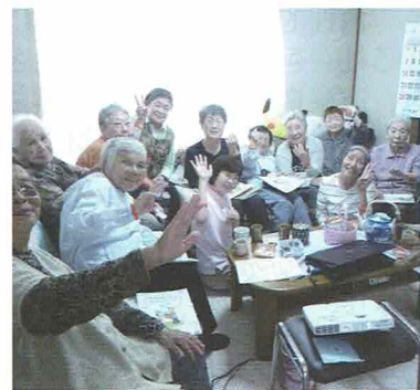
『だんらん』で 認知症サポーター養成講座

いております。一人暮らしの方の閉じこもり予防、地域の助け合いに繋げていきたいと思っています。