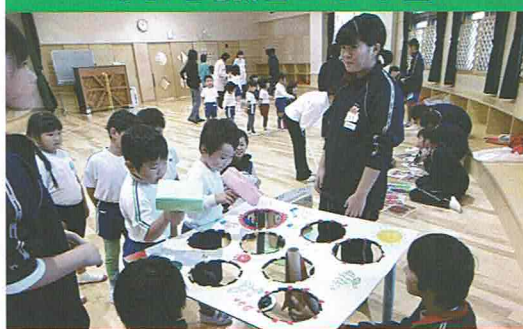
中学生徒との交流

あまぎ認定こども園には今年も天城中学の二年生が家庭科の授業で作ったおもちゃを持って一緒に遊ぼうとやってきてくれました。