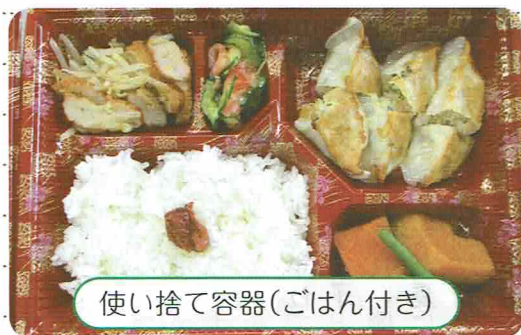
使い捨て容器(ごはん付き)