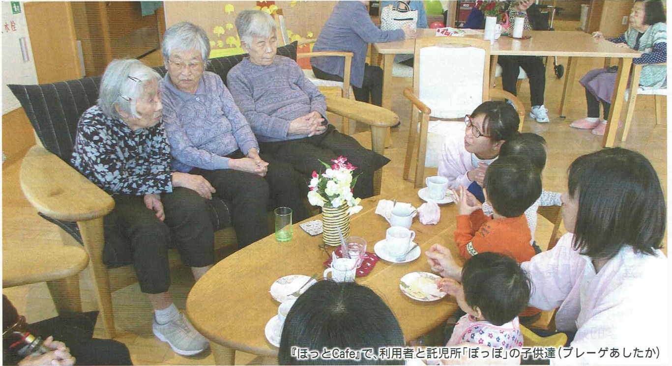
『ほっとCafe』で、利用者と託児所「ほっぼ」の子供達(ブレーグあしたか)