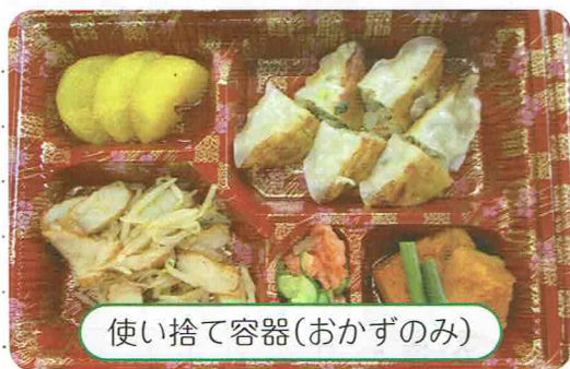
使い捨て容器(おかずのみ)