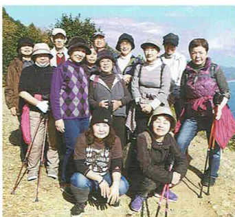
薩埵峠で ウォーキング

現在原・浮島地区では、住民の方が主体となってサークルを発足し活動するまでになりました。今年度は更なる普及活動として、3地区(一本松・桃里・植田)限定で3回の開催をいたしました。