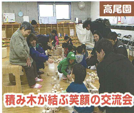
積み木が結ぶ笑顔の交流会

高尾園では地域貢献事業の一つとして、保育園に積み木を贈る活動を一年九ヶ月続けていて寄贈した保育園やこども園合わせて十四ヶ所、贈った積み木の数は五千六百個になります。