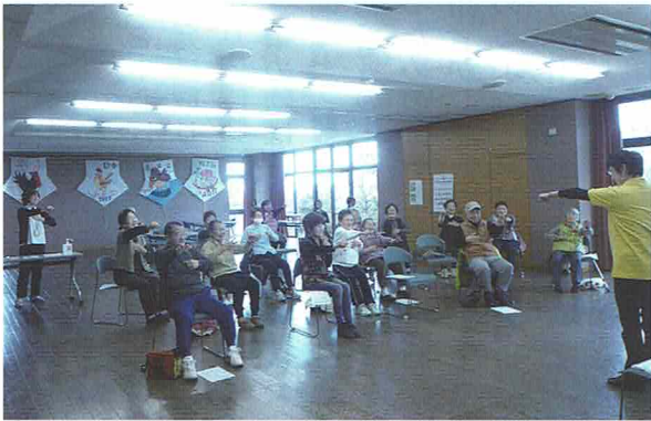
『うきしまサロン』で体操

高齢者サロンは地域の皆様が気軽に「仲間づくり」「健康づくり」「出会いづくり」をするための活動の場です。原・浮島の地区センターにて毎週交互に開催しています。活動内容は、脳と身体のリレーニングとして運動・ゲーム・唱歌などを行い、介護予防の普及・啓発、生活の質の向上に繋がる支援をしています。参加者は六十五歳以上の高齢者の方で、今では帰りにお茶をする顔なじみの仲に発展しています。サロンが生活の中で楽しみとなり、いきいきと安心して暮らせる町づくりのお役に立てればと思っています。