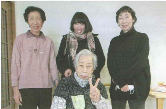
会食会での一コマ

今年度も「あしたかホーム」と「プレーゲあしたか」では、十月に中学生の職場体験学習の受け入れをしました。市内四校より延べ五十二名の参加がありました。初めての福祉施設での体験で、戸惑ったり緊張を隠せない生徒さんもありますが、どの生徒さんも真剣に取り組み、一日の最後には笑顔で終えることが出来ました。毎年この職場体験を機会に福祉の関心を持つ生徒さんもあります。その感想文のひとつをご紹介します。